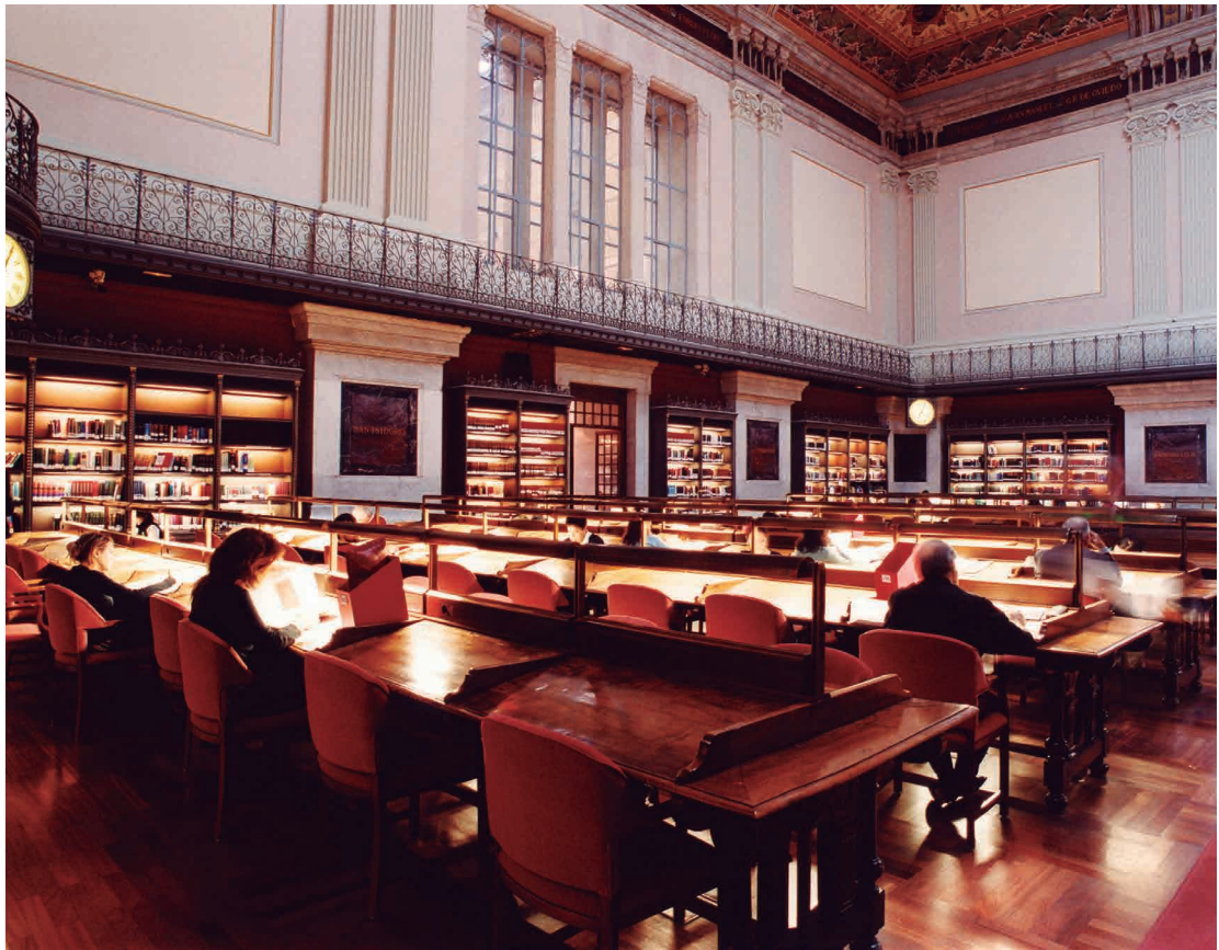
Figura 1. Biblioteca Nacional de España. Sala general de lectura.