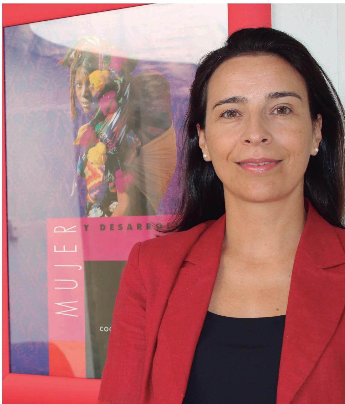
Figura 1. Carmen Plaza Martín, Directora General del Instituto de la Mujer.