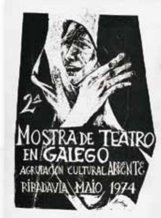
Carteis da Mostra de Teatro Galego de Ribadavia, organizada por Abrente (1974), e do Festival Folk Galego, organizado polo Galo e polo Facho en 1975

A asistencia será pública, invitándose particularmente a títulos interesados nas materias arqueolóxicas, etnográficas, etc., celebradas por Cuevillas. Pis en Galo que penses acudir ao acto referido, acompañanos as respostas galgas de Odróez da Mía.