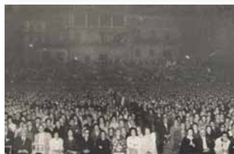
Pasquín e fotografía da representación de Os vellos de Castelao na praza da Quintana (Santiago, 1961)