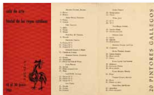
Díptico da mostra 20 pintores gallegos , primeira actividade cultural organizada polo Galo (xuño de 1961)