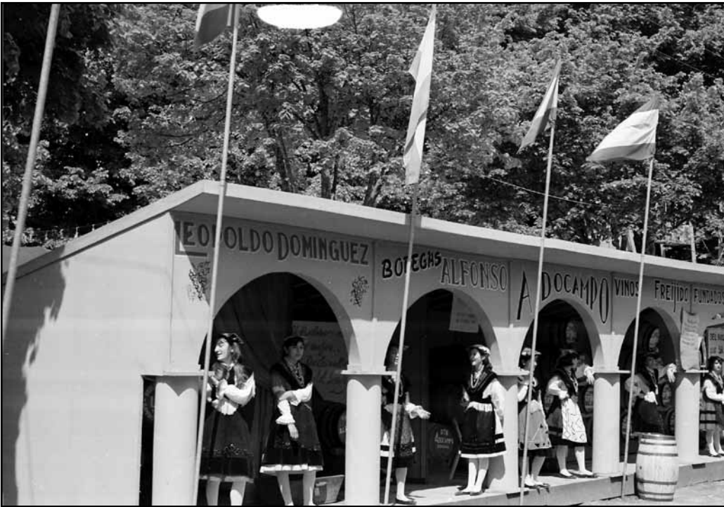
1ª Feira do Viño do Ribeiro.