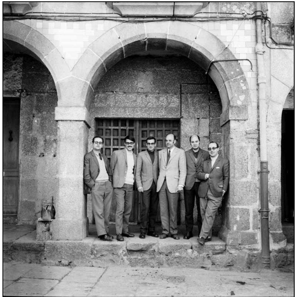
Fundadores da Agrupación Fotográfica de Ribadavia.

que tivemos ocasión de traballar con AFAOR (Asociación de Familiares de Enfermos de Alzheimer de Ourense), co Centro Penitenciario de Pereiro de Aguiar (Ourense) e coa delegación da Cruz Vermella en Ribadavia 4 . Neles a versatilidade e o potencial memorizador da fotografía resultaron útiles para desenvolver sesións de reminiscencia con persoas enfermas de alzhéimer, como recurso experimental no traballo coa poboación reclusa e para prospectar a súas posibilidades no traballo con persoas con discapacidade psíquica. Experiencia que mereceu a mención de honra no III Premio Iberoamericano de Educación e Museos e da cal ten sido publicada a correspondente memoria recollendo tanto a formulación como os resultados obtidos 5 .